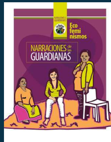
Narraciones de las guardianas Guardianes y guardianas de la creación